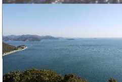
ハイツからの眺め